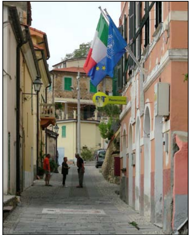
Vasia: la strada principale con il palazzo del Comune