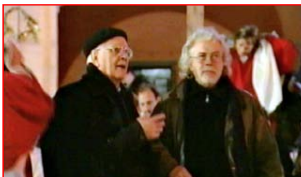
Alcune scene della Tragedia tratte dalle riprese del film di Richard Blank