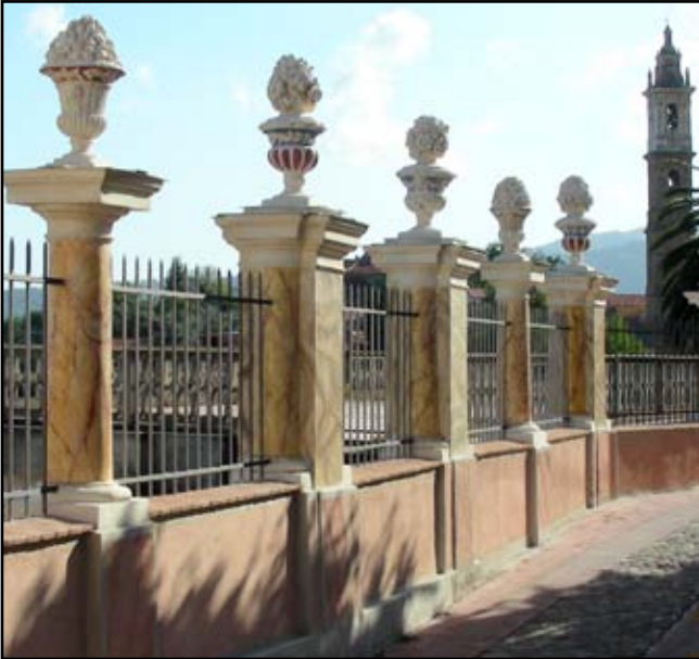
Vasia: una particolare strada interna