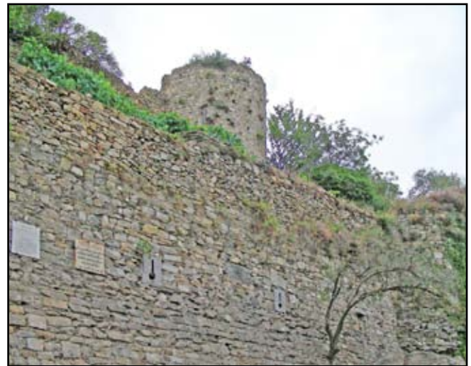
Prelà: i ruderi del castello

Terra particolarmente religiosa e gente dedicata al prossimo la Val Prino, in quanto era proprio di queste parti uno degli ultimi eremiti erranti della Liguria. Egli era soprannominato "Pre Presin" ma il suo vero nome era Cosimo di Pantasina. Era un laico che girava vestito come un prete e veniva ormai considerato quasi un santo per la vita di povertà che conduceva. Era un uomo mite che girava per i paesi e si accontentava di un giaciglio di paglia: aiutava nei piccoli lavori chi ne aveva bisogno in casa come nei campi ed il tempo si fermava quando ai ragazzini raccontava una delle sue storie che ascoltavano incantati. A volte spariva nella nebbia dell'alba e per giorni nessuno sapeva più nulla di lui fino a che lo si vedeva ricomparire lontano sulla linea dell'orizzonte. La sua