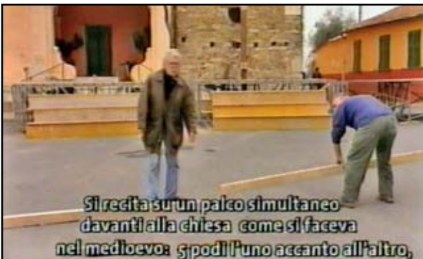
Si recita su un palco simultaneo davanti alla chiesa come si faceva nel medioevo: 5 podi l'uno accanto all'altro,