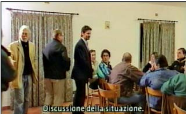
Discussione della situazione.