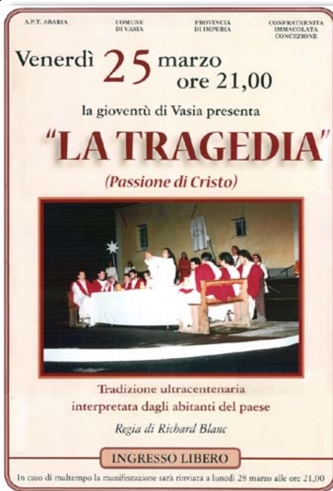
Il manifesto pubblicato in occasione della "Tragedia"

tivamente inservibile durante la guerra contro i Savoia ed i loro alleati Francesi, nel lontano 1625.