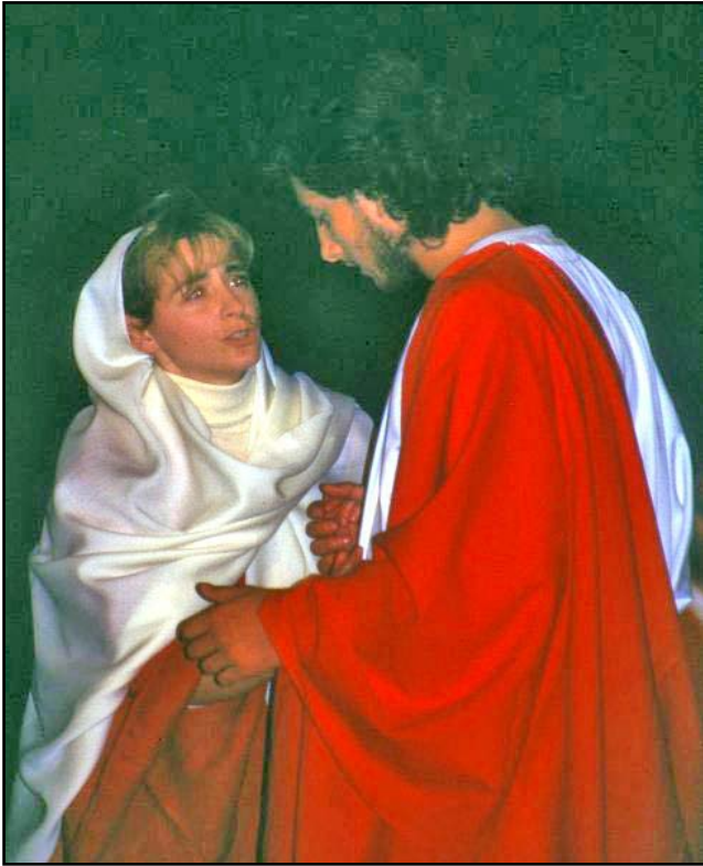
Vasia: la "tragedia" del "Venerdì Santo" (2000)

difensiva e governativa, fulcro politico e militare della valle. Il titolo di "Contea di Pietralata" rimarrà fino al passaggio del territorio in mano sabauda, a seguito dell'espansionismo piemontese del 1575-1576, arrivando fino allo scalo marittimo di Oneglia e della valle Impero, costituendo così un importante territorio di disturbo per Genova. I Conti si concentrarono sui commerci e sullo sviluppo della produzione olivicola, togliendo a poco a poco lo spazio ai boschi di castagni e roverelle. Nel fondovalle sorsero molti mulini che si andarono ad aggiungere a quelli costruiti già all'epoca dei feudatari Doria. Alcuni trasformati o rifatti sono tutt'ora esistenti.