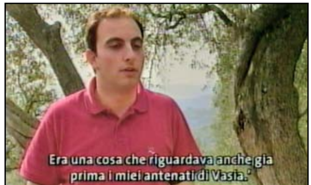
Era una cosa che riguardava anche già prima i miei antenati di Vasia.'