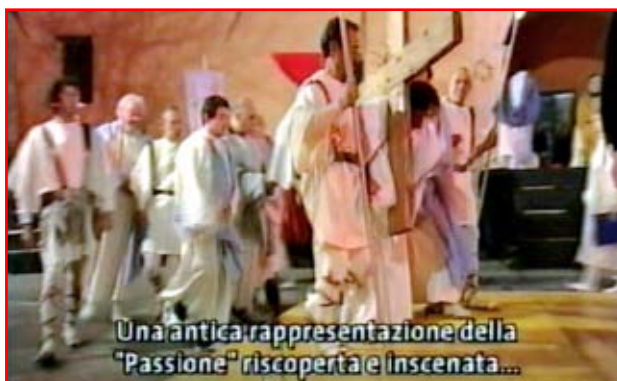
Una antica rappresentazione della "Passione" riscoperta e inscenata...