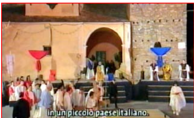
in un piccolo paese italiano.