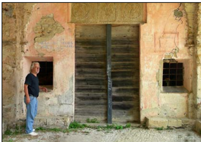
S. Anna: l'antica chiesetta con il regista Richard Blank

Visitata Vasia si può proseguire ritornando in piazza, e poi in macchina, o camminando attraverso alcuni dei suoi sentieri. Si arriva così ad altre frazioni: al piccolo borgo di Torretta, alla frazione di Pianavia o, scendendo verso valle, a Prelà Castello ed alla Pieve dei Santi Giacomo e Nicola. Il Castello è oggi poco più di un rudere, memore di antiche battaglie e frutto di una probabile ricostruzione tardo medievale. Furono i genovesi, assieme ai loro alleati spagnoli, a renderlo defini-