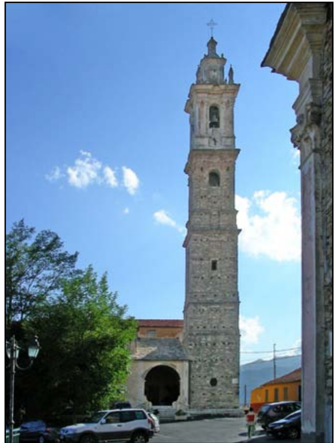
Vasia: il campanile della chiesa di S. Antonio Abate

La storia narrata ci fa apprendere che il regista, interpellato sull'eventuale sua disponibilità ad impegnarsi nella rappresentazione, fosse un poco scettico e titubante in quanto non gli si poteva presentare nessuna documentazione scritta o perlomeno una traccia da seguire. Molte persone in paese ricordavano i monologhi a memoria, ma ognuno per la sua parte e mancava il filo conduttore che legasse gli avvenimenti. La storia, si sa, è conosciuta da tutti, ma quello che si voleva rappresentare non era una storia come le altre ma quella realmente presentata a Vasia nei tanti anni passati.