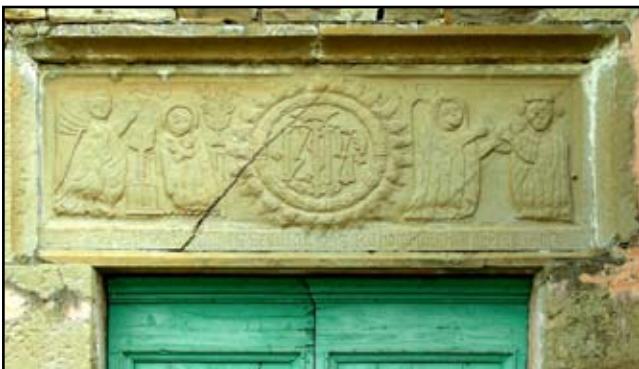
Vasia: sopraporta antichi

Ancora qualche curva e si intravede in lontananza, adagiato su un arco