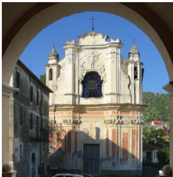
Vasia: l'oratorio dell'Immacolata Concezione

La "Tragedia", seppure rappresentata nei secoli, e quindi con una fortissima tradizione, sarebbe forse caduta nel dimenticatoio travolta dalle mille meraviglie multimediali e visive della nostra epoca. Queste mal si concilierebbero con le rappresentazioni stori-