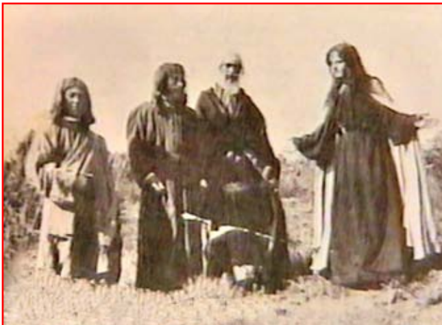
L'antica fotografia di una delle rappresentazioni di molti anni fa