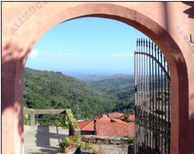
Vasia: una visione panorama fino alla costa fotografia di E. Pelos

tra, si sono tradotte negli anni in una crescita edilizia con alcuni palazzi importanti anche all'interno dell'abitato.